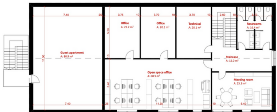
Kantoor ruimte en gasten verblijf