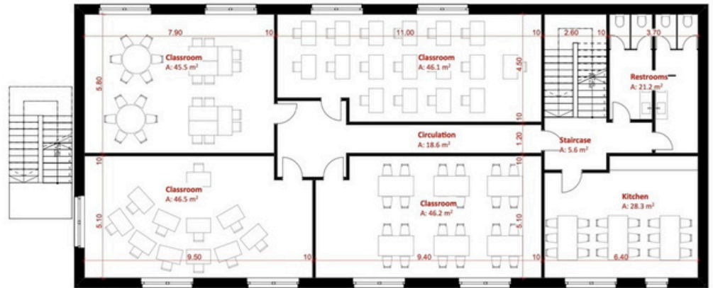
De vier nieuwe ruime klaslokalen en keuken